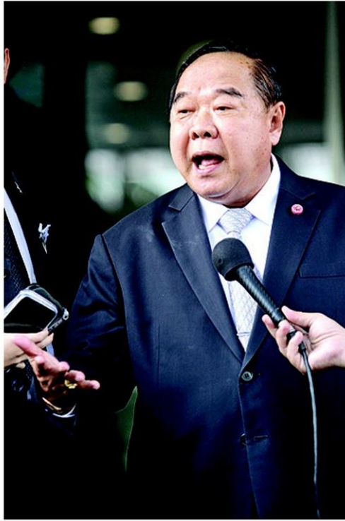
พล.อ.ประวิตร วงษ์สุวรรณ

กล่าวกับเกษตรกรในภาคใต้ก่อน โดยไม่ต้องตรวจสอบเงื่อนไข หากใครเดือดร้อนก็ต้องซื้อ ส่วนจำนวนเกษตรกรที่รัฐบาลจะเข้าไปรับซื้อโดยตรงมีที่รายนั้นตนยังไม่ทราบ แต่เอาจำนวนปริมาณที่จะซื้อ 1 แสนตันเป็นตัวตั้ง จะซื้ออย่างทุกชนิดจากเกษตรกร แต่ไม่ใช่ยางเก่า เพราะซื้อมาแล้วเอามาเก็บไม่ได้ต้องรีบใช้ให้หมด เมื่อเป็นการซื้อขายสด จึงเชื่อว่าราคายางพาราจะขยับขึ้น