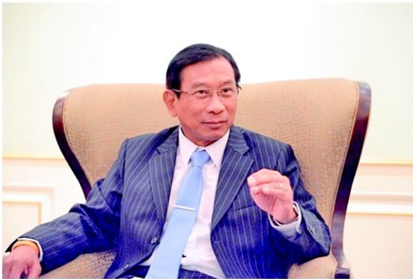
พล.อ.อัศวิน ชัยกิตติ์

ส่วนลด ติดต่อที่ KTC หรือที่ “กัณฑ์รัตน์ เจริญมิตรพอง” สวยอมตะ ได้เลย ●●... ยามตลาดหุ้นซบเซา ก็ต้องหาอะไรบันเทิงใจทำบ้าง “ตลาดหลักทรัพย์” เลยร่วมมือกับวิทยาลัยดุริยางคศิลป์ มหาวิทยาลัยมหิดล เชิญผู้สนใจร่วมชมการประกวด “SET เยาวชนดนตรีแห่งประเทศไทย ครั้งที่ 18” รอบชิงชนะเลิศ เวทีส่งเสริมให้เยาวชนแสดงความสามารถทางดนตรีอย่างสร้างสรรค์ โดยเปิดรับเครื่องดนตรีทุกชนิดที่ไม่ใช้ไฟฟ้า รวมถึงการขับร้องโดยไม่จำกัดแนวเพลงการประกวด พบกับผู้เข้ารอบชิงชนะเลิศรวม 40 คน ตั้งแต่ระดับประถมศึกษา มัธยมศึกษาตอนต้น มัธยมศึกษาตอนปลาย และระดับอุดมศึกษา ในวันอาทิตย์ที่ 17 ม.ค. 2559 เวลา 08.30-17.00 น. ณ หอแสดงดนตรีวิทยาลัยดุริยางค