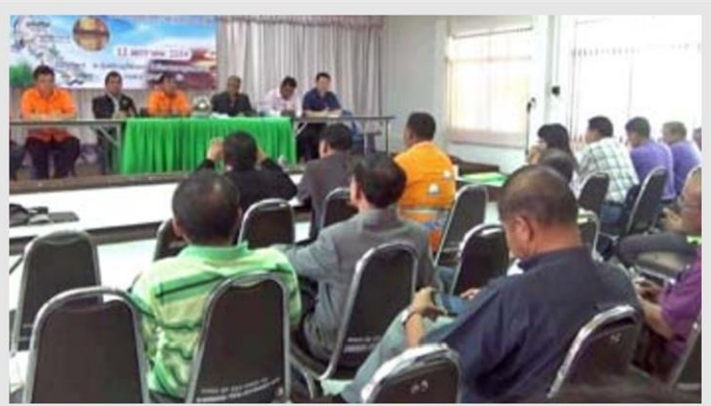
บีเพิ่มราคาขาย - กลุ่มเกษตรกรชาวสวนยางในภาคใต้ รวมตัวกันที่ สกย.ตรัง หลังได้รับความเดือดร้อนอย่างหนักจากราคายางที่ตกต่ำเป็นประวัติการณ์จนบาง พื้นที่เหลือแค่กิโลกรัมละ 20 บาทเศษๆ หรือ 4 กิโลฯ 100 บาท โดยที่ประชุมมี มติให้เวลารัฐบาลในการผลักดันราคายางพาราเป้าหมายอยู่ที่กิโลกรัมละ 60 บาท ภายใน 30 วัน

3. คณะทำงานขับเคลื่อนการแก้ไขปัญหา ยางพาราเพื่อกำหนดมาตรการเชิงรุกช่วยเหลือเกษตรกรยางพารา เป็นกรณีเร่งด่วน จะ ดำเนินการในลักษณะเป็นหน่วยบริหารจัดการ กลางในการประสานไปยังส่วนราชการและหน่วย งานภาครัฐ ที่มีงาน/โครงการต้องดำเนินการจัด