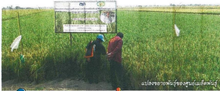
แปลงขยายพันธุ์ของศูนย์เมล็ดพันธุ์