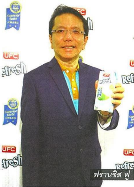
พรานชิส ฟู

สินค้าไทยไม่แพ้ชาติใดในโลก พิสูจน์ได้จากบริษัท อาหารสากล จำกัด (มหาชน) ผู้ผลิตและจัดจำหน่ายผลิตภัณฑ์อาหารและเครื่องดื่มภายใต้ตราสินค้า ยูเอพีซี เป็นผลิตภัณฑ์ใหม่ น้ำมะพร้าวแท้ 100% “ยูเอพีซี รีเฟรช” ได้รับรางวัลการันตีด้านรสชาติความอร่อย Superior Taste Award 2015-2 ดาว จาก 3 ดาว หรือรสชาติดีเยี่ยม (หรือเทียบเท่ากับลินสเตอร์ 2 ดาว) จากสถาบันรับรองด้านรสชาติและคุณภาพอาหารระดับนานาชาติ กรุงบริสเซลส์, ประเทศเบลเยียม” นอกจากสร้างชื่อให้กับแบรนด์ผู้ผลิตแล้วยังเป็นการสร้างเครดิตให้กับสินค้าการเกษตรของไทย โดยเฉพาะ “มะพร้าวไทย” รสชาติไม่แพ้ชาติใดในโลก เตรียมโปรโมทแคมเปญใหญ่ Taste of World Class บอกถึงรสชาติและคุณประโยชน์ของน้ำมะพร้าว เจาะกลุ่มรักสุขภาพ ก่อนขยายช่องทางจำหน่ายในต่างประเทศไปทั่วโลก