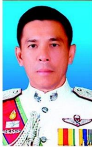
พล.ต.ท.ชาญเทพ เสสะเวช