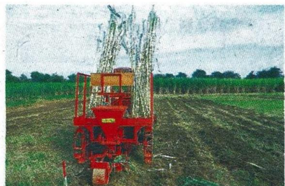
ผลงานวิจัยของศูนย์วิจัยและพัฒนาการเกษตรสุพรรณบุรี

ไม่ว่าจะเป็นพันธุ์ถั่วเขียว 2 พันธุ์ พันธุ์อ้อย 18 พันธุ์ และพันธุ์ข้าวฟ่าง 4 พันธุ์ ทั้งยังมี ผลงานวิจัยเกี่ยวกับการป้องกันกำจัดศัตรูอ้อย