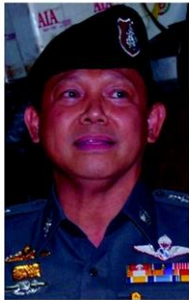
พล.ต.อ.พงศพัทธ์ พงษ์เจริญ

•...ประเด็นร้อนต้นสัปดาห์ บทเรียนหนุ่ม พงษ์การรถไฟ “พิชิต บุญแดง” ปากพางจัน ริ แชนแอร์สาว “เก็บกระเป๋าคูณะ ระวังระเบิดนะ” ประโยคสั้นๆ บนสายการบินไทยไลอ้อนแอร์ เที่ยวบิน SL 8536 ก่อนเครื่องบินขึ้น ทำเอาทำไม่ออกกันทั้งลำ นักบินงัดการบินเพื่อตรวจสอบกระเป๋าทั้งหมดบนเครื่อง ปรากฏว่าไม่มีอะไรในกอไฟ ประเด็นกฎหมายใหม่ข้อหา “แจ้งข้อความหรือส่งข่าวสารซึ่งรู้อยู่แล้วว่าเป็นเท็จ และการแจ้งนั้นเป็นเหตุหรือน่าจะเป็เหตุให้ผู้อื่นที่อยู่ในท่าอากาศยาน หรืออยู่ในระหว่างการบินตื่นตกใจ” พ.ร.บ.ว่าด้วยความผิดบางประการต่อการเดินอากาศ พ.ศ.2558 โทษคุก 5-15 ปี ปรับ 200,000-500,000 บาท “บักจู้” พล.ต.อ.พงศพัทธ์ พงษ์เจริญ รอง ผบ.ตร. นำตัวแดงลงขังเป็นอุทธรณ์สำหรับผู้โดยสารบนเครื่องบิน... • ติดตาม หลังกรมปทุมวันพยายามอยู่หลายรอบ เปลี่ยนมาหลายรัฐบาล ติดก็หลายหน สุดท้ายก็ล้มฤทธิ์ ราชกิจจานุเบกษาประกาศเรื่องกำหนดวิธีการแจ้งการชุมนุมสาธารณะ-ประกาศเรื่องเครื่องมือควบคุมฝูงชนในการชุมนุมสาธารณะ 48 ชนิด บังคับใช้ตั้งแต่ 4 พ.ย. มีอบการเมือง มีอบปากท้อง โปรด่าน ศึกษาข้อกฎหมาย มีขั้นตอนระบุ อาทิ แจ้งเจ้าหน้าที่ตำรวจก่อนชุมนุม 24 ชั่วโมง แจ้งเจ้าหน้าที่ระดับหัวหน้าสถานีมากกว่า 1 พื้นที่ ฯลฯ ฝ่าฝืนมีโทษ... • คลับติตัวโรงเรียนดัง ใกล้สถานทูตหลายแห่ง เด็กนักเรียน ผู้ปกครอง และครูจะเข้าโรงเรียนตอนเช้า พบหนุ่มสาวนัวเนียกันจนติดตา ทั้งที่มี พ.ร.บ.บังคับใช้ แต่ไม่มีใครจัดการ!!... • ไม่ตกเทรนด์ ตู้บริการ