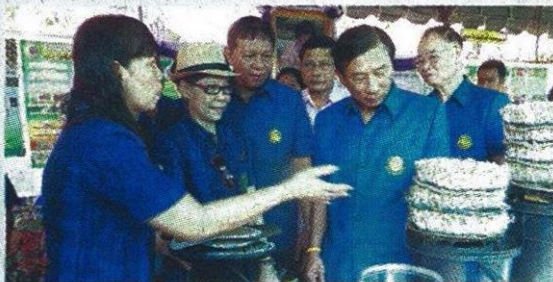
พล.อ.ฉัตรชัย สาริกัลยะ (ที่ 2 จากขวา) พร้อมด้วย สมชาย ชาญณรงค์กุล (ที่ 3 จากซ้าย) ขมนวัตกรรมและการเพาะถั่วงอกในงานวันถ่ายทอดผลงานวิจัย

พล.อ.ฉัตรชัย สาริกัลยะ รัฐมนตรีว่าการกระทรวงเกษตร