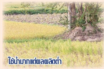
ใช้น้ำมากแต่ผลผลิตต่ำ

นอกจากนี้ ควรส่งเสริมให้ความรู้เกี่ยวกับการผลิตปุ๋ยให้แก่เกษตรกรเพื่อใช้เอง จะทำให้เกษตรกรสามารถลดต้นทุนในการซื้อปุ๋ยลงได้ และควรจัดหาหรือขายพันธุ์อ้อยโรงงานที่มีราคาถูกให้แก่เกษตรกรที่อยู่ในพื้นที่ที่เหมาะสมกับการปลูกอ้อยโรงงาน เพื่อลดต้นทุนให้กับเกษตรกรที่