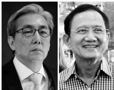
สมคิด จาตุศรีพิทักษ์ สมชาย วงศ์สวัสดิ์

● การก่อสร้างโครงสร้างพื้นฐานล่าช้ามานาน โดยเฉพาะโครงการรถไฟฟ้าทางคู่ โครงการรถไฟฟ้ากรุงเทพ และบริมณฑล สมคิด จาตุศรีพิทักษ์ รองนายกฯ แย้มว่า 'บิ๊กตู่' พร้อมงัดมาตรา 44 เพื่อเร่งรัดงานให้เร็วขึ้น