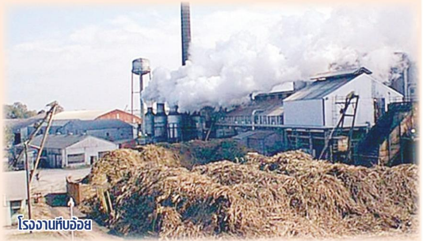
โรงงานหีบอ้อย