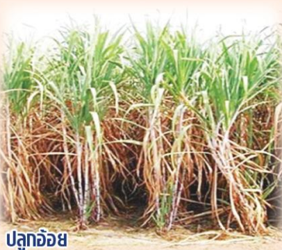
ปลูกอ้อย