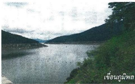
เขื่อนภูมิพล