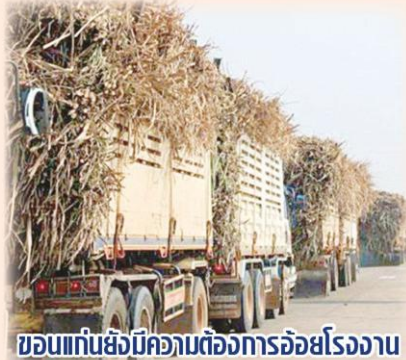
ขอนแก่นยังมีความต้องการอ้อยโรงงาน