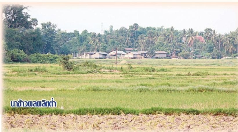
นาข้าวพลผลิต

ตัดสินใจของเกษตรกรในการเปลี่ยนพื้นที่ที่ไม่เหมาะสมในการปลูกข้าวแล้วหันไปปลูกอ้อยโรงงานแทนในพื้นที่จังหวัดขอนแก่น โดยรวบรวมข้อมูลจากการสัมภาษณ์เกษตรกรผู้ปลูกข้าวที่ได้มีการปรับเปลี่ยนไปปลูกอ้อยโรงงานและที่ไม่ได้ปรับเปลี่ยนไปปลูกอ้อยโรงงาน รวม 323 คน ในปีการเพาะปลูก 2556/57 ที่ผ่านมา