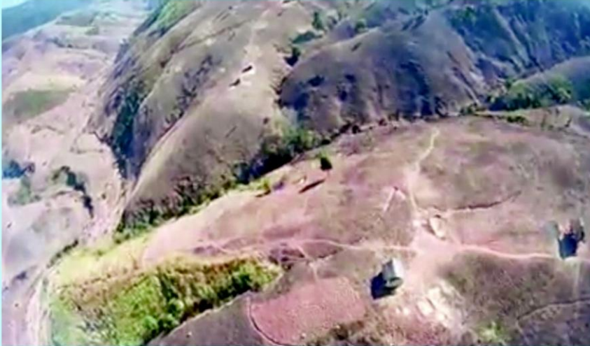
พื้นที่ป่าบนภูเขาสูงใน จ.น่าน ถูกโค่นจนเห็นเตียนกลายเป็นภูเขาหัวโล้น