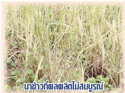
ข้าวที่ผลผลิตไม่สมบูรณ์