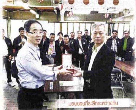
มอบของที่ระลึกหว่างกัน

สำหรับการนำตัวแทนสหกรณ์/กลุ่มเกษตรกรเดินทางไปศึกษาดูงาน ในครั้งนี้ นาย โอบาส กลั่นบุญชัย อธิบดีกรมส่งเสริมสหกรณ์ เผยว่า กรมฯ ได้ดำเนินการคัดเลือกเกษตรกร จากกลุ่มเป้าหมาย ประกอบด้วย สหกรณ์ภาค การเกษตร/กลุ่มเกษตรกรดีเด่นแห่งชาติ ตั้งแตปี 2556-2558 และสหกรณ์ที่ดำเนินการ สนองนโยบายรัฐบาลและกระทรวงเกษตร และสหกรณ์ ซึ่งเข้าร่วมดำเนินโครงการตาม นโยบาย