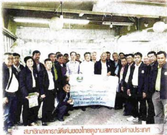
สมาชิกสหกรณ์ดีเด่นของไทยดูงานสหกรณ์ต่างประเทศ