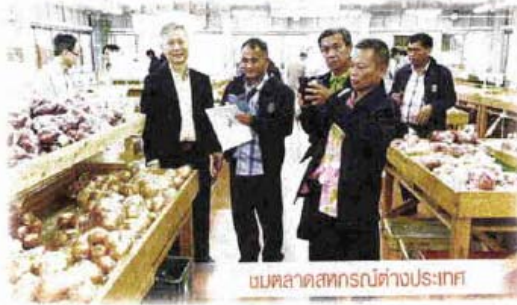
ชมตลาดสหกรณ์ต่างประเทศ

เช่น สหกรณ์ที่เป็นศูนย์กระจายสินค้า สหกรณ์ (CDC) ในระดับภาค สหกรณ์ที่ดำเนิน โครงการปรับโครงสร้างการผลิต เพื่อเพิ่ม ประสิทธิภาพการผลิตและการตลาดปาล์มน้ำมัน แบบครบวงจร สหกรณ์ดีเด่นในพื้นที่โครงการ หลวง และสหกรณ์ที่เป็นศูนย์เรียนรู้ที่สามารถนำ เสนอผลงานในการสร้างความเข้มแข็งต่อระบบ สหกรณ์ ภายใต้แนวคิด "สหกรณ์มั่นคง สมาชิก มั่งคั่ง ประเทศยั่งยืน" เป็นต้น รวมทั้งหมด 78 สหกรณ์ 10 กลุ่มเกษตรกร จาก 43 จังหวัด