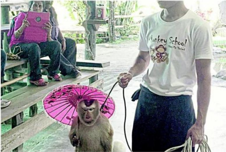
CROWD PLEASER: Above and below, monkeys perform at a 'school' in Chiang Mai province.

Once the breeder issues documents indicating that a monkey is from the farm, the buyer can take the documents to the DNP, which checks the area the monkey will be raised in and issues a permit for the new owner. Since the law was enacted in 1992, the government held two rounds of registration for people to obtain legal permits for their monkeys — one in 1992 and another in 2003 — regardless of the animal's origin.