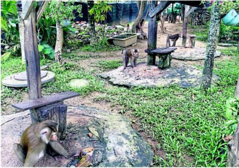
ON A TIGHT LEASH: Macaques are often kept on short chains due to their aggressiveness.