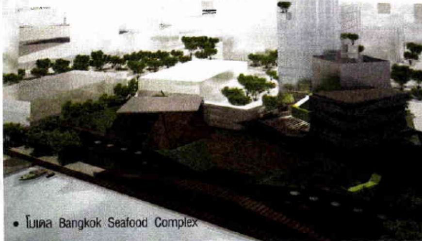
• โมเดล Bangkok Seafood Complex