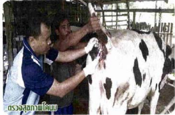
ตรวจสอบสภาพโคนม