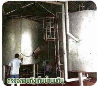
ตรวจสอบถึงเก็บนมดิบ