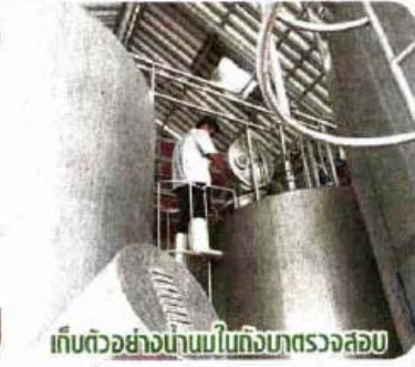
เก็บตัวอย่างนมในโกดังมาตรวจสอบ

อาหารเสริม (นม) โรงเรียนทั่วประเทศ และ สำนักงานปศุสัตว์เขต 3 ได้แจ้งให้สำนักงาน ปศุสัตว์จังหวัดศรีสะเกษ ทำการตรวจสอบ ปริมาณและคุณภาพน้ำนม พร้อมทั้งกับจังหวัด อื่น ๆ ที่มีการเลี้ยงโคนม