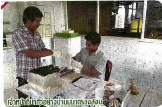
เจ้าหน้าที่นักตัวอย่างนมมาตรวจสอบ