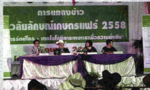
แถลงข่าวจัดงานวลัยลักษณ์เกษตรแฟร์

สำหรับกิจกรรมที่จะเกิดขึ้นในงานมีการจัดนิทรรศการ ปาล์มน้ำมันครบวงจร การเลี้ยงสัตว์ในสวนปาล์ม นิทรรศการ กุ้งครบวงจร นิทรรศการถ่ายทอดองค์ความรู้ภูมิปัญญาท้องถิ่นจากปราชญ์ชุมชน การแสดงพันธุ์สัตว์ รวมทั้งการ