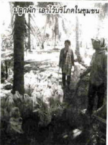
ปลูกผัก เอากะโหลกในชุมชน