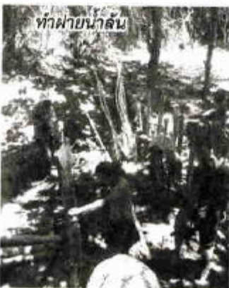
ทำฝายน้ำล้น