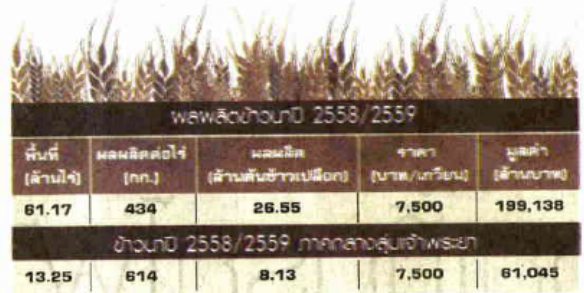
ที่มา : สำนักงานเศรษฐกิจการเกษตร (สศก.)

ประชาชชาติด้านสินค้าเกษตรที่จะ จับจ่ายใช้สอยหายไปจากระบบ เศรษฐกิจ 6 หมื่นล้านบาท อย่างไรก็ตาม ภาครัฐไม่ได้ตั้งใจ ใดจะมีมาตรการช่วยเหลือผ่าน เงิน 6 หมื่นล้านบาท เพื่อช่วยเหลือ ในเรื่องลดรายจ่ายและช่วยเหลือ ด้านปัจจัยการผลิตและโครงการ ต่างๆ ซึ่งในช่วงที่ชะลอทำนาช่วง 2 เดือนนี้ เกษตรกรสามารถจะเข้า ร่วมโครงการของกระทรวงเกษตร และสหกรณ์ที่ได้เตรียมไว้ เช่น ศูนย์ เรียนรู้การเกษตรแบบเบ็ดเสร็จ 882