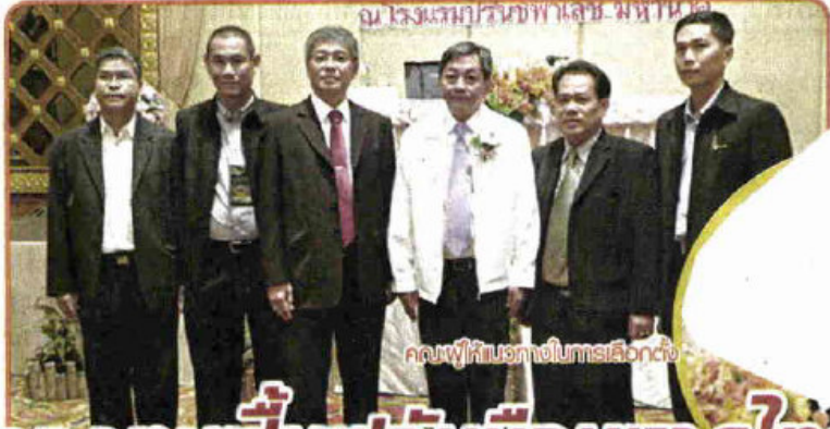
คนผู้แทนจากจังหวัดภูเก็ต

ผู้เข้าสัมมนาสามารถบริหารจัดการเลือกตั้ง และนำความรู้ ไปอบรมสัมมนา