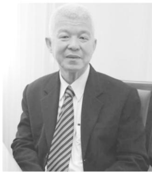
ประสิทธิภาพมากขึ้นด้วย

ดังนั้น การปรับระบบส่งเสริมการเกษตรแปลงใหญ่ จะก่อให้เกิดความร่วมมือในการผลิตโดยเกษตรกรหรือองค์กรเกษตรกรในพื้นที่ที่มีการดำเนินกิจกรรมที่ติดต่อกันเป็นแปลงใหญ่ ทำให้เกิดขนาดเศรษฐกิจที่ใหญ่ขึ้น (Economy of Scale) เป็นการเพิ่มอำนาจการต่อรองของเกษตรกรตลอดกระบวนการผลิต และห่วงโซ่อุปทาน ได้แก่ การจัดการปัจจัยการผลิต เทคโนโลยีการเก็บเกี่ยว การจัดการหลังการผลิต การแปรรูปเบื้องต้น และการตลาด อีกทั้งยังก่อให้เกิดความสะดวกในการรวบรวมสรรพกำลังของหน่วยงานในสังกัดกระทรวงเกษตรฯ และผู้เกี่ยวข้องให้เข้าไปดำเนินการส่งเสริมสนับสนุนได้อย่างมี