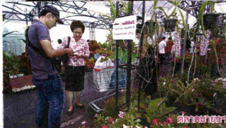
ดีกคัก...รอนยงต์สามลือออชุธยา เข้าวร่นคอรกการใชคูปองส่วนลด 10-เปอร์เซนต์ จาก นสพ.เดลิมิวส์ พาหวิพระสุง วัด ใน จ.พระนครศรีอยุธยา (ภาพกลางและขวา) ประชาชนสนใจซื้อสินค้าในเทศกาลไม้ดอกไม้ประดับและปลาสวยงาม ที่ริมคลองผดุงฯข้างท่าเทียบรฐบาล