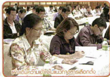
เพื่อสืบความเข้าใจในแนวทางจัดการเลือกตั้ง

สำหรับที่มาของการมีผู้แทนเกษตรกร กองทุนฟื้นฟู