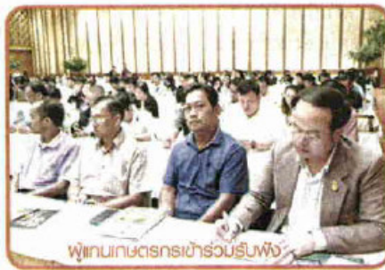
ผู้แทนเกษตรกรเข้าร่วมรับฟัง