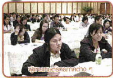
ผู้แทนเกษตรกรจากต่าง ๆ

เจ้าหน้าที่ระดับอำเภอ และเขต ได้อย่างมีประสิทธิภาพ โดยเปิดโอกาสให้ผู้เข้าสัมมนาได้ซักถามและแสดงความคิดเห็นเกี่ยวกับการบริหารจัดการเลือกตั้งผู้แทนเกษตรกร พ.ศ. ๒๕๕๘ และนำไปปฏิบัติได้อย่างถูกต้อง เพื่อเป็นไปตามขั้นตอนตามที่คณะกรรมการอำนวยการเลือกตั้ง ได้มีมติเห็นชอบ และเนื่องจากการดำเนินการเลือกตั้งผู้แทนเกษตรกรมีกฎหมายกำหนดไว้เป็นการเฉพาะ ซึ่งแตกต่างจากการเลือกตั้งสมาชิกผู้แทนราษฎร สมาชิกวุฒิสภา และสมาชิกสภาท้องถิ่น เพื่อให้ผู้ที่เกี่ยวข้องได้ชี้แจงข้อกฎหมายและแผนบริหารจัดการเลือกตั้งให้ผู้มีหน้าที่รับผิดชอบทั้งการจัดการเลือกตั้งและการติดตามประเมินผลได้รับทราบ