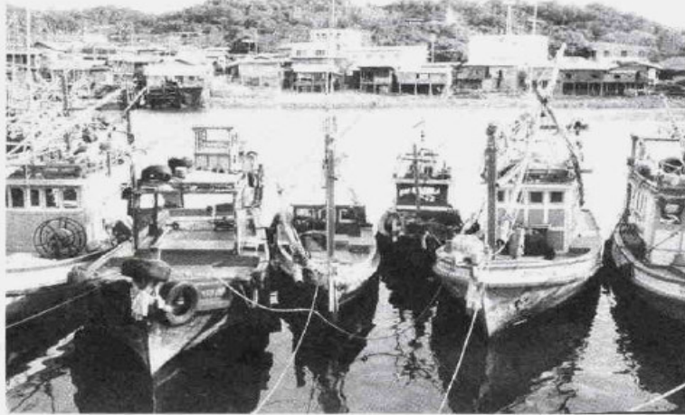
เคลียร์ปัญหาไม่จบ - ชาวประมงไทยกำลังเผชิญปัญหาในการทำประมงในประเทศเพื่อนบ้านอย่างหนัก หลังอินโดนีเซียประกาศปิดน่านน้ำต่ออีก 6 เดือน