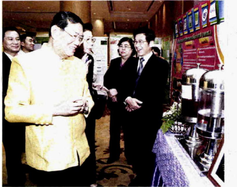
วิจัยข้าว - นายอำนาจ ปะติเส รมช.กระทรวงเกษตรและสหกรณ์ เป็นประธานพิธีเปิด การสัมมนาเสนอผลงานวิจัยประจำปีงบประมาณ 2556 ซึ่งจัดโดยสำนักงานคณะกรรมการ วิจัยแห่งชาติ (วช.) ภายใต้แผนงานวิจัยมุ่งเป้าตอบสนองความต้องการพัฒนาประเทศ โดยเร่งด่วน คือ "กลุ่มเรื่องข้าว" ณ โรงแรมมิราเคิล แกรนด์ คอนเวนชั่น