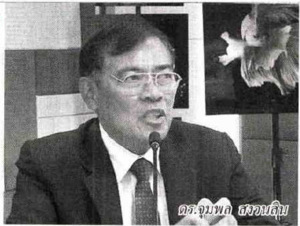
ดร.จุมพล สงวนสิน

ด้าน ดร.จุมพล สงวนสิน อธิบดีกรมประมง กล่าวเพิ่มเติมว่า ผลจากการดำเนินการปรากฏว่า ได้ให้บริการตรวจคัดกรองโรคกุ้งทะเลแก่เกษตรกร ทั้งแบบที่เรีย และไวรัส ด้วยเทคนิค PCR โดยดำเนินการตรวจแล้วเสร็จ ณ ปัจจุบันทั้งสิ้นจำนวน 76,540 ตัวอย่าง และมีการดำเนินการผลิตหัวเชื้อจุลินทรีย์ (ปม.1) สูตรผง แจกจ่ายให้เกษตรกรแล้วทั้งสิ้นจำนวน