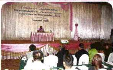
วิสาหกิจร่วมรับฟังข้อมูลและแนวทาง สำนักงานกองทุนสงเคราะห์การทำสวนยาง สำนักงานเศรษฐกิจการเกษตรและกรมส่งเสริมการเกษตร กำหนดระยะเวลาจ่ายเงินกู้ 1 ก.ย. 57-30 มี.ย. 58 โดยคิดอัตราดอกเบี้ยร้อยละ 4 ซึ่ง

โดยมีกรมส่งเสริมสหกรณ์เป็นหน่วยงานหลัก ร่วมกับ ธนาคารเพื่อการเกษตรและสหกรณ์ การเกษตร (ธ.ก.ส.) กรมตรวจบัญชีสหกรณ์