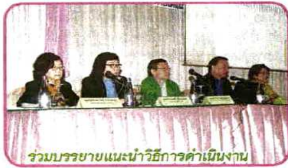
ร่วมบรรยายแนะนำวิธีการดำเนินงาน

ชุมชน ให้คำแนะนำแก่วิสาหกิจชุมชนที่เข้าร่วมโครงการ ตลอดจนให้ความรู้และคำแนะนำในการดำเนินธุรกิจรวบรวมหรือรับซื้อยางแก่วิสาหกิจชุมชนที่ได้รับสินเชื่อ พร้อมทั้งรายงานความก้าวหน้าและประเมินผลในส่วนที่รับผิดชอบและเพื่อให้การดำเนินงานสนับสนุนสินเชื่อแก่วิสาหกิจชุมชนเป็นไปอย่างมีประสิทธิภาพเกิด