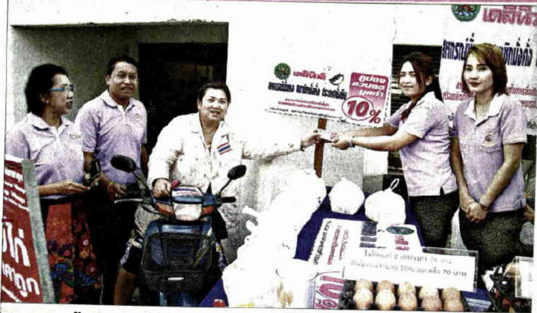
▲ หมดเกลี้ยง...ประชาชนนำคูปองส่วนลด 10% ที่ตัดจากหนังสือพิมพ์เดลินิวส์มาซื้อไข่ไก่ที่สหกรณ์ จังหวัดอ่างทองนำมาวางขายหน้าธนาคารกสิกรไทย สาขาอ่างทอง แม้เพียงครึ่งเดียวก็ขายจนหมดเกลี้ยง

ชาวอ่างทองพกคูปอง ส่วนลด“เดลินิวส์” แลก ซื้อไข่สหกรณ์ราคาถูก พองละ ♦อ่านต่อหน้า 9