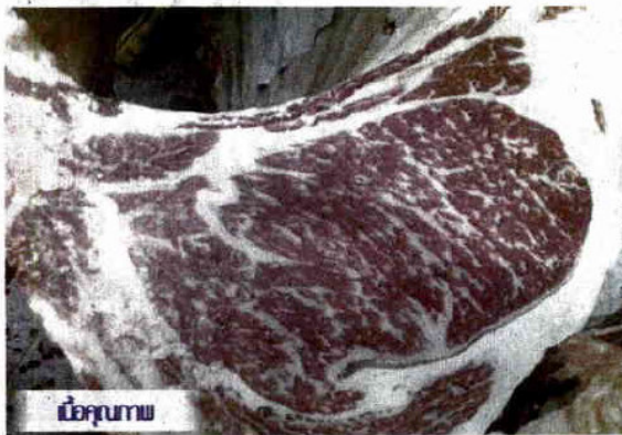
เนื้อคุณภาพ