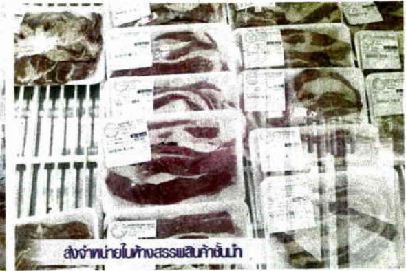
ส่งจำหน่ายในห้างสรรพสินค้าชั้นนำ

จดทะเบียนประเภทสหกรณ์การเกษตร มีฐานะเป็นนิติบุคคลขึ้นตรงต่อกรมส่งเสริมสหกรณ์ กระทรวงเกษตรและสหกรณ์ ปัจจุบันประกอบ การในหลายธุรกิจ หนึ่งในนั้นก็คือบริการส่งเสริม สมาชิกเลี้ยงโคขุนลูกผสมไทย ยูโรป และรับซื้อโค ที่ขุนเต็มที่แล้วเพื่อนำเข้าโรงฆ่าและแปรรูปเป็น ผลิตภัณฑ์ ตลอดจนจำหน่ายสินค้าประเภทอาหาร โคขุน ทั้งปลีกและส่ง ให้แก่เกษตรกรและผู้บริโภค โดยทั่วไปที่เลี้ยงโคเนื้อ โคขุน