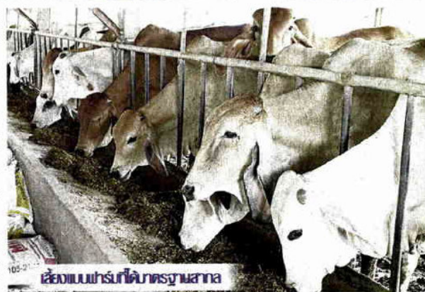
เลี้ยงแบบฟาร์มที่ได้มาตรฐาน

สำหรับโคขุนของสมาชิกสหกรณ์หนองสูง นั้น เป็นโคขุนที่ได้รับการส่งเสริมพัฒนาอย่างถูกต้องตามหลักวิชาการของกรมปศุสัตว์ มีเกษตรกรกลุ่มผู้เลี้ยงแม่ผลิตลูก ที่ขึ้นทะเบียนเกษตรกร ผ่านการฝึกอบรมเรียนรู้พัฒนาด้านการจัดการ เลี้ยงโค การพัฒนาฟาร์มให้ได้มาตรฐาน ตลอดจน การดูแลสุขภาพโค การผสมเทียมและติดตามลูกโคที่เกิดจากโครงการ พร้อมได้รับการสนับสนุนปัจจัย วัสดุพัฒนาฟาร์มโคเนื้อโคขุนต้นแบบ ฟาร์มโคเนื้อ มาตรฐานจากหน่วยงานที่เกี่ยวข้อง มีการใช้แร่ธาตุ สำหรับโค และยาถ่ายพยาธิโค อย่างถูกวิธี ตามหลักวิชาการ