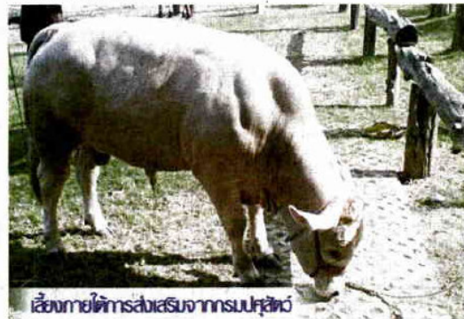
เลี้ยงภายใต้ระบบส่งเสริมจากรัฐ

สหกรณ์แห่งนี้เป็นหนึ่งในสหกรณ์การเกษตรที่เข้าร่วมกับกรมส่งเสริมสหกรณ์ และหนังสือพิมพ์เดลินิวส์ ในโครงการขบวนการสหกรณ์ไทย ร่วมใจลดค่าครองชีพ โดยตัดคูปองส่วนลด 10 เปอร์เซ็นต์ จากหนังสือพิมพ์เดลินิวส์ที่ตีพิมพ์ในหน้ากีฬา ไปแลกซื้อสินค้าเนื้อโคขุนคุณภาพ ตามที่สหกรณ์นำมาร่วมรายการได้ทุกวันที 1-10 ของทุกเดือนตลอดของการจัดโครงการ