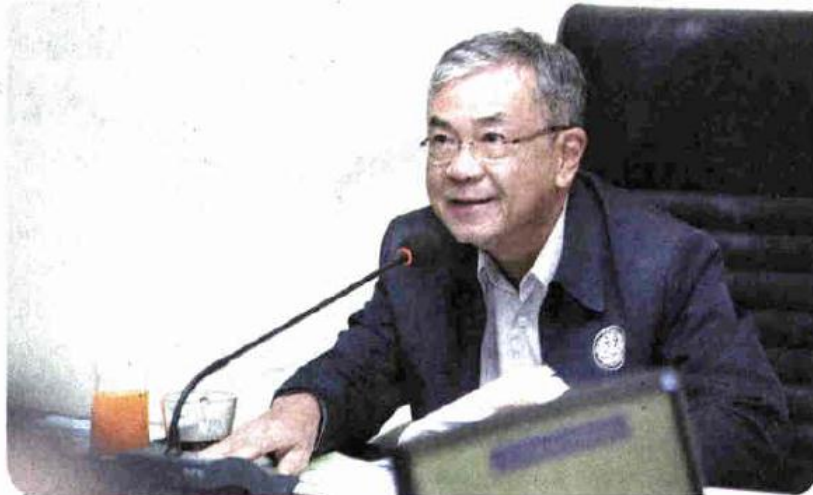
นายปดิพงษ์ ฟังบุญ ณ อรุณยา รัฐมนตรีว่าการกระทรวงเกษตรและสหกรณ์

หากจะกล่าวถึงประวัติศาสตร์ด้านการเกษตรของประเทศไทยแล้วคงต้องย้อนไปถึงหลักฐานที่บันทึกในศิลาจารึกตั้งแต่สมัยสุโขทัย ปี พ.ศ. 1800 ซึ่งได้กล่าวถึงการให้ประชาชนได้มีอิสระในการประกอบอาชีพตามความถนัด โดยส่วนใหญ่ประกอบอาชีพเกษตรกรรมที่ดินที่มีการปลูกสร้างทำประโยชน์ล้วนตกเป็นกรรมสิทธิ์แก่ผู้ที่ปลูกสร้าง และให้เป็นมรดกตกทอดไปถึงลูกหลาน และส่วนหนึ่งในบันทึกดังกล่าวยังได้กล่าวถึงความอุดมสมบูรณ์ ของประเทศที่มีน้ำสะอาดสำหรับบริโภคได้ตลอดทั้งปี และพอเพียงสำหรับใช้ในการเกษตร กระทั่งในสมัยกรุงศรีอยุธยาเริ่มตั้งแต่ พ.ศ. 1893 ได้มีการก่อตั้ง “กรมนา” ซึ่งเป็นกรมหนึ่งในการปกครองแบบจตุสดมภ์ ซึ่งได้มีการพัฒนามาอย่างต่อเนื่อง จากกระทรวงพาณิชย์การ กระทรวงเกษตรพาณิชย์การ กระทรวงเกษตรราธิการ กระทรวงเศรษฐกิจ กระทรวงเกษตร จนมาเป็นกระทรวงเกษตรและสหกรณ์ตามลำดับ โดยถือเอาวันที่ 1 เมษายน 2435 เป็นวันสถาปนากระทรวง และสหกรณ์ ด้วยสมัยต้นรัชกาลที่ 5 เป็นยุคของการเริ่มปรับปรุงส่วนราชการ และจัดตั้งกระทรวงต่างๆ ซึ่งถือเป็นยุคทองของการก้าวสู่ความเจริญก้าวหน้าของประเทศ