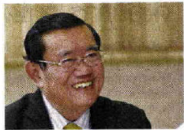
อำนาจ ปะติเส

แนวทางระบายนางออกจากสต็อกที่ประมุข กมย. ท้าหรือว่าจะยึดตามมติ ครม. ให้ระบายนางช่วง ที่ราคาเหมาะสมไม่ระบายช่วงราคาตกต่ำเพราะจะ ยิ่งทำให้ราคาลดลง โดยขณะนี้สถานการณ์ราคา ยางในประเทศ ราคาเอฟโอบีขยับขึ้นมาที่ 60 บาท/กก. ใกล้กับราคาที่รัฐบาลรับซื้อไว้ที่ 63.15 บาท/กก. ส่วนเอ็มไออยู่กับเงินเรื่องสินค้าเกษตร คือ