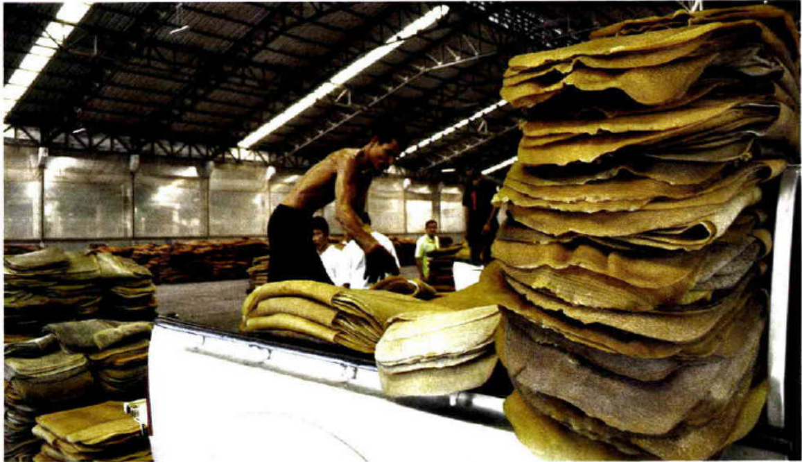
หนาแน่น - จากการศึกษาการสวนยาง (อ.ส.ย.) ประมูลซื้อขายแผ่นรมควันชั้น 3 ถึง กก.ละ 62-63 บาท ในขณะที่ผ่านตลาดกลางขนาดใหญ่ เช่น ตลาดกลางสุราษฎร์ธานี นครศรีธรรมราช และสงขลา ทำให้ผู้ขายนำยางมาขายกันจำนวนมาก

กก.ละ 30 บาท ที่สำคัญจะอย่างไรไม่ให้ยางจากประเทศเพื่อนบ้านไหลทะลักเข้ามาขายกันถ้าไรส่วนต่างที่ค่อนข้างมาก