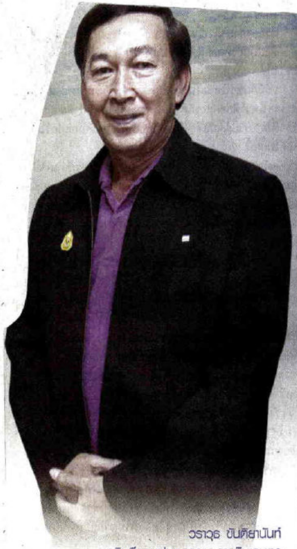
วราวุธ ชันติยานันท์ อธิบดีกรมฝนหลวงและการบินเกษตร

อธิบดีกรมฝนหลวงและการบินเกษตร กล่าวถึงปัญหาและอุปสรรคในการดำเนินงานว่า ปัญหาสำคัญอยู่ที่ความชื้นในอากาศ เพราะการทำฝนหลวงจะต้องใช้น้ำต้นทุน (ความชื้นในอากาศ) ในการทำฝนหลวง แต่ถ้าน้ำน้อยและแห้ง ความชื้นในอากาศจะต่ำ เพราะฉะนั้นปริมาณน้ำที่จะดึงมาเป็นเมฆเป็นฝนก็จะน้อยลงไปด้วย แต่อากาศบ้านเราก่อนข้างจะแปรปรวนอาทิตย์นี้ความชื้นน้อย แต่