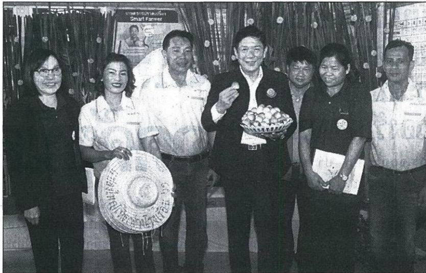
ลงพื้นที่ : นายลักษณ์ วจนานวัช รัฐมนตรีและสหกรณ์ ลงพื้นที่ตรวจเยี่ยม ผลการดำเนินงานของกลุ่มวิสาหกิจชุมชนเห็ดและผักปลอดสารพิษบ้านหนองบัว ด.บ้านช่อง อ.พนมสารคาม จ.ฉะเชิงเทรา