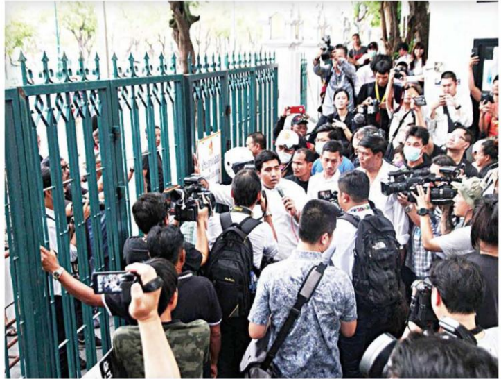
▲ ตัดใจ...ผู้ชุมนุมกลุ่มคนอยากเลือกตั้งใช้ความขนาดใหญ่ตัดใช้กุญแจประตูบุกเข้าไปรวมตัวหน้าคณะนิติศาสตร์ มหาวิทยาลัยธรรมศาสตร์ ทำพระจันทร์ หลังเจ้าหน้าที่นำแม่กุญแจและโซ่คล้องมาล็อกประตู 3 ฝั่ง ท้องสนามหลวง เพื่อห้ามไม่ให้ทำกิจกรรมใด ๆ โดยผู้ชุมนุมต่างไม่พอใจที่ถูกขัดขวาง ประกาศปักหลักค้างคืนก่อนจะเดินขบวนบุกทำเนียบรัฐบาล

ที่ บชน. พล.ต.อ.ศรีวราห์ ริงสิพรหมณกุล รอง ผบ.ตร. กล่าวถึงกรณีที่มีกลุ่มผู้ชุมนุมจะนอนค้างคืนที่มหาวิทยาลัยธรรมศาสตร์เพื่อเตรียมทำกิจกรรมเช้าวันที่ 22 พ.ค. ว่า ได้ดำเนิน ผกค.สน.ชนะสงคราม ไปแล้วว่าไปนอนดีได้อย่างไร ได้ให้แก๊ซยกเลิกไปแล้ว เมื่อวันที่ 20 พ.ค. การชุมนุมเพื่อเรียกร้องให้มีการเลือกตั้งเร็วขึ้นมันขัดการชุมนุมทางการเมือง ขัดคำสั่งของ คสช. ไม่สามารถทำได้หากจะรวมตัวฝ่าฝืนกฎหมายเราก็จะดำเนินการตามกฎหมายสำหรับการเดินที่นั่นตนจะลงไปตรวจสอบด้วยตนเองเพราะใกล้เขตพระราชฐานระยะ 150 เมตรมาก โดยมีการจัดเตรียมกำลัง 3-20 กองร้อย ตามสถานการณ์ จากทางการข่าวยังยืนยันว่า มีกลุ่มเสื้อฮาร์ดคอร์แน่นอนแต่อยู่ที่ว่าเราจะหยุดอยู่หรือไม่ ทั้งนี้ วันที่ 22 พ.ค. จะมีการชุมนุมก็ถือว่าทหารเค้าอนุมัติหรือไม่ หากไม่มีการอนุมัติก็ไม่สามารถทำได้โดยสั่งให้ 50 เมตร รอบทำเนียบรัฐบาลเป็นพื้นที่เฝ้าระวัง เมื่อวันที่ 20 พ.ค. ที่จังหวัดนนทบุรีก็พบระเบิดเก่ามีคนเอามาทิ้งไว้